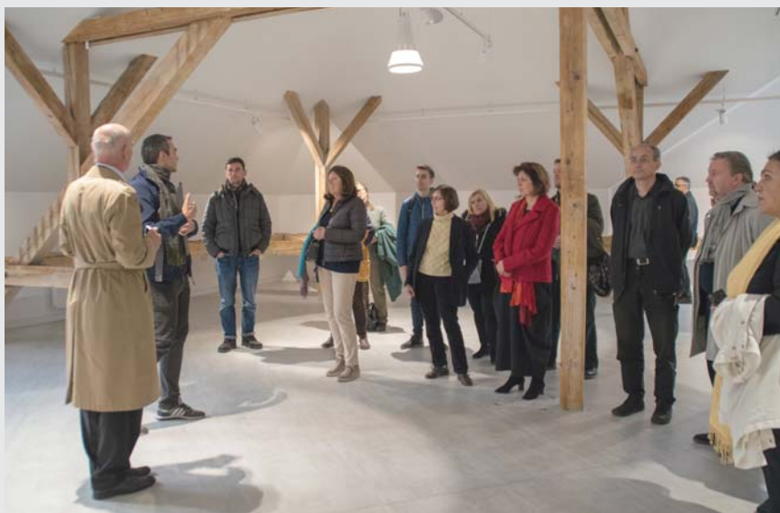
Vznikajúce Centrum architekta L. E. Hudeca v zrekonštruovaných priestoroch Späthovej vily.