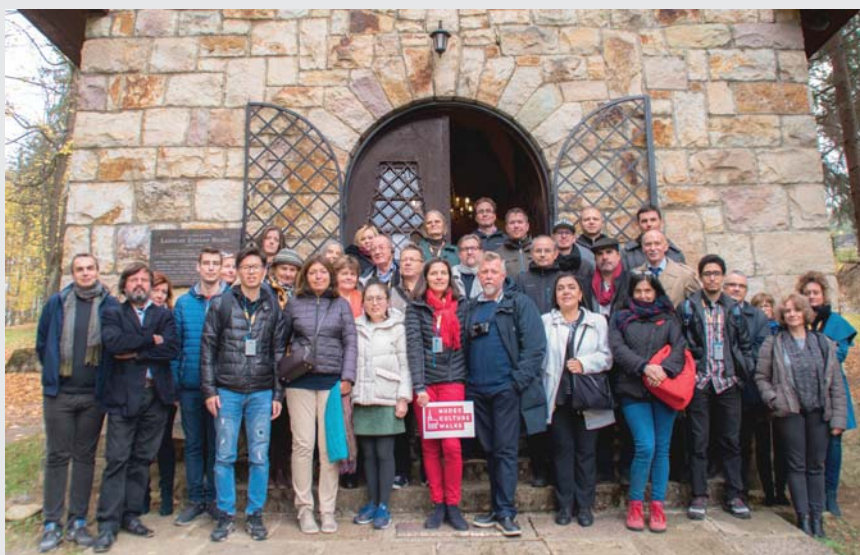
Prehliadka kúpeľnej Kaplnky Panny Márie Kráľovnej vo Vyhniach s účastníkmi Hudec Cultural Walk z Budapešti.