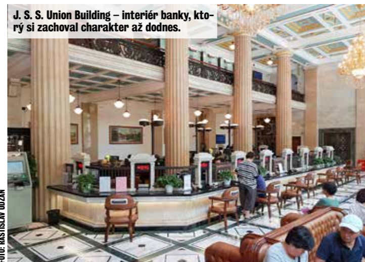
J. S. S. Union Building – interiér banky, ktorý si zachoval charakter až dodnes.