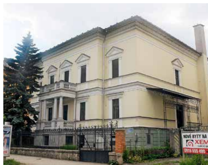
Rodinný dom L. E. Hudeca na Skuteckého ulici.