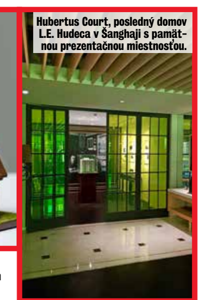
Hubertus Court, posledný domov L. E. Hudeca v Šanghaji s pamätnou prezentačnou miestnosťou.