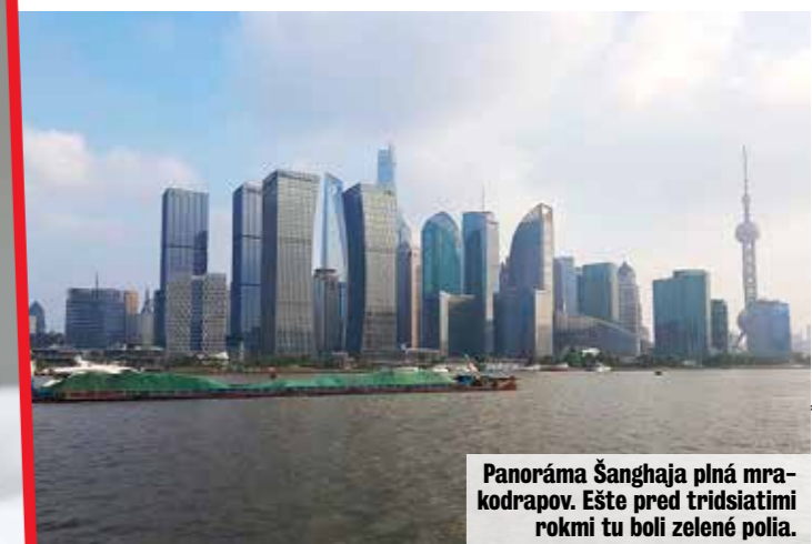
Panoráma Šanghaja plná mrakodrapov. Ešte pred tridsiatimi rokmi tu boli zelené polia.