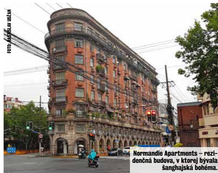
Normandie Apartments – rezidenčná budova, v ktorej bývala šanghajská bohéma.

Po skončení druhej svetovej vojny sa situácia pre cudzincov v Šanghaji značne skomplikovala. Nad mestom sa vznášal tieň podozrení a obviňovaní z kolaborácie, zmietalo sa v občianskej vojne. Hudecovi myšlienky sa opäť upriamili na rodnú krajinu, chcel sa s celou rodinou presťahovať do Dolnej Mičinej neďaleko Banskej Bystrice. Aj tieto plány však zmaril nástup komunistického diktátora. Po dvoch „vyčkávacích“ rokoch vo Švajčiarsku v roku 1949 usúdil, že najbezpečnejšou alternatívou je cesta do Spojených štátov. V tom čase už neprojektoval, len príležitostne prednášal na univerzitách. Býval vo vile s výhľadom na záliv Golden Gate, no po čase začal dom praskať a architekt sa musel vysťahovať. Ako najrýchlejšia alternatíva sa mu javila výstavba už skôr naprojektovaného montovaného domu podľa vlastného návrhu, ktorý mu priviezli z Európy. Počas jeho stavby však